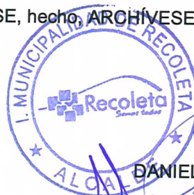
DANIEL JADUE JADUE ALCALDE MUNICIPALIDAD DE RECOLETA